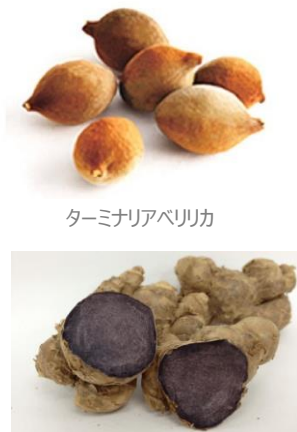
ターミナリアベリリカ

今回、新製品として発売するのは、脂肪や糖の吸収を抑える「ターミナリアベリリカ由来没食子酸」と、脂肪を消費しやすくする「ブラックジンジャー由来ポリメトキシフラボン」配合。「ターミナリアベリリカ」は、インド・スリランカなど東南アジアに生息するポリフェノールを多く含むスーパーフルーツ。「ブラックジンジャー」は、タイ・ラオスなどの山間地で生息する伝統的な植物です。食事の脂肪や糖の吸収を抑えるだけでなく、脂肪を消費しやすくするサプリメント。1日に2粒、好きな時に飲むだけで、食事の度に摂取する必要がないので、食べすぎが気になる時だけでなく、日々の体調管理にもとり入れやすいサプリメントです。